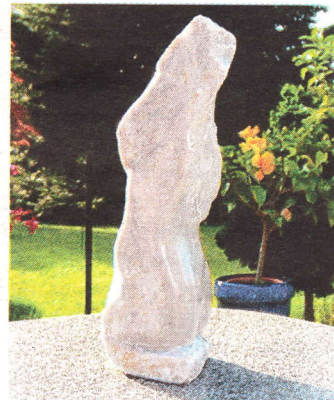
Der Steingeist und seine Angebotete